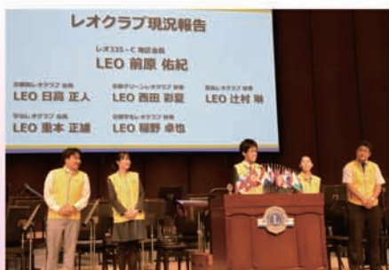
レオクラブ現況報告