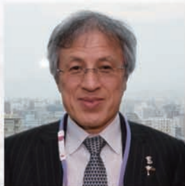
地区 LCIF 委員長

国際協会の考えは、各クラブに家族会員が在籍し、アクティビティに貢献するのが一般的なクラブの姿であるとのこと。