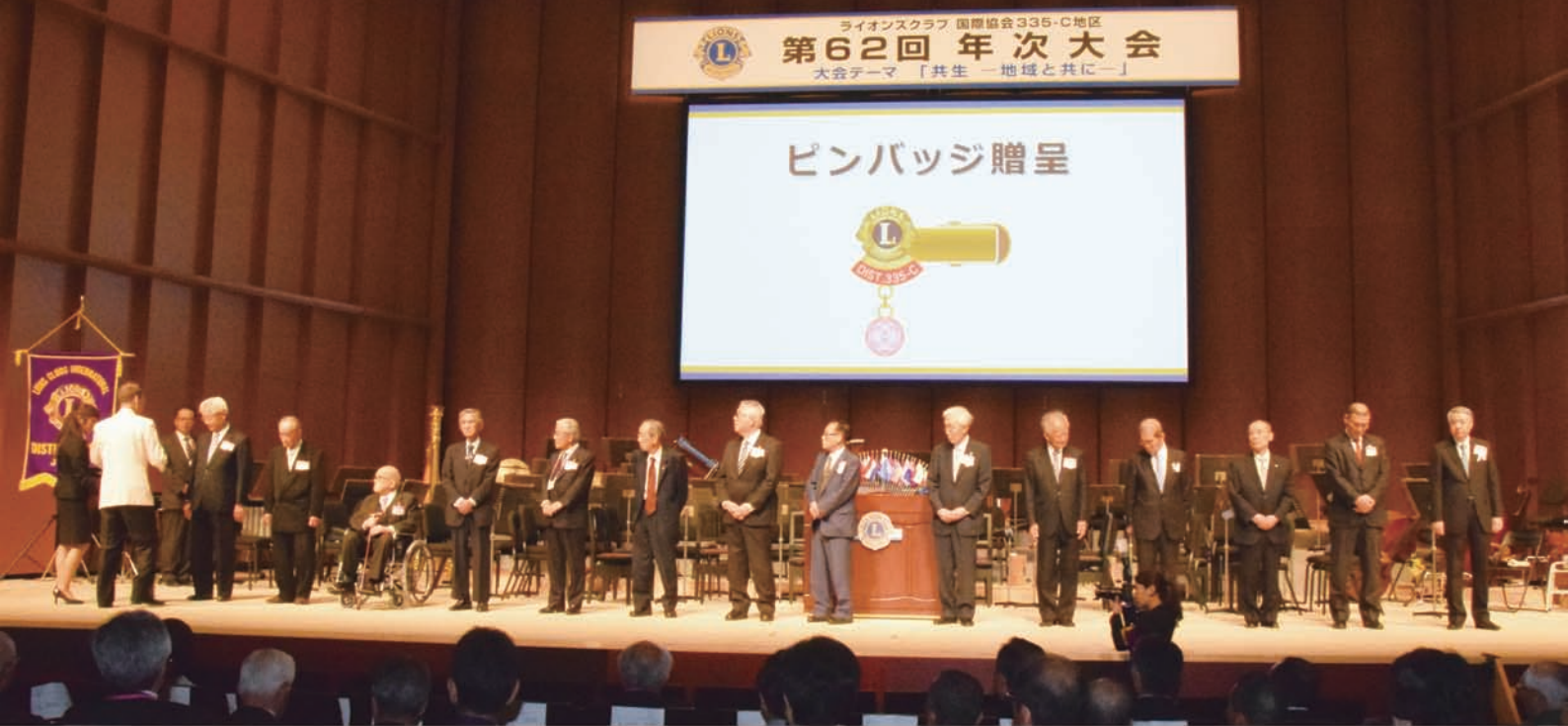
元ガバナーへの感謝