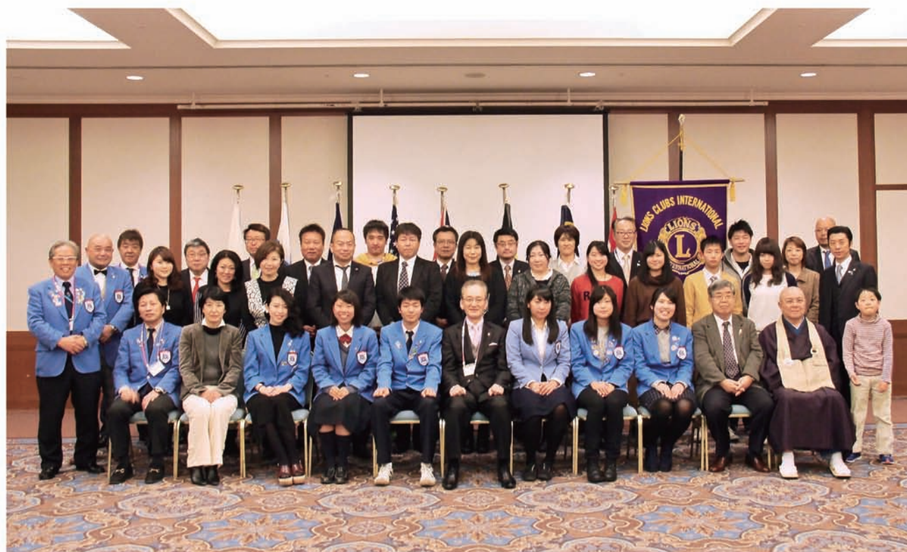
ライオンズクラブ国際協会335-C地区 2015年度YCE派遣学生帰国報告会 2016年2月21日 於 京都ホテルオークラ