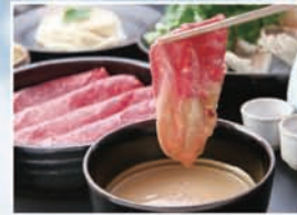
近江スエヒロ本店