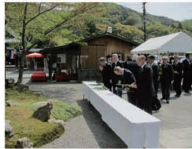
「第18回アイバンク感謝の集い」愛の光石碑前にて 献眼者ご遺族と共に

※多額のご支援を有難うございました。 (2016. 1. 27～2016. 4. 20) (敬称略)