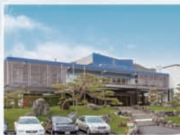
甲賀カントリー倶楽部