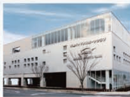
大津イトマンスポーツクラブ