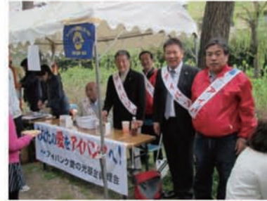
京都桃山ライオンズクラブ「第十回桃山語り部の道 桃山桜まつり」にて