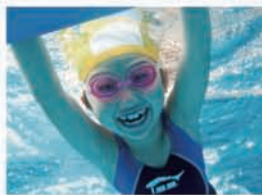
堅田イトマンスポーツクラブ