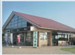
甲南パーキングエリア(上り線・下り線)