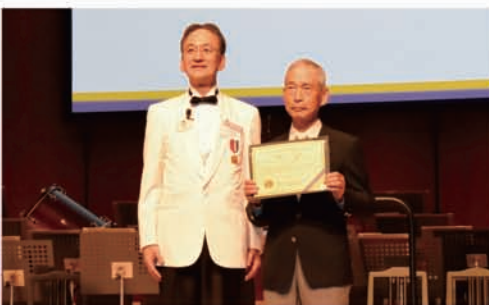
環境保全写真コンテスト表彰