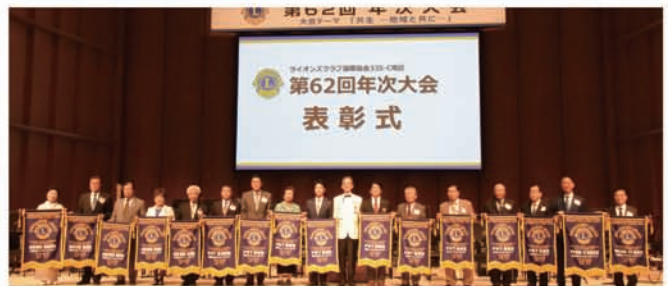
部門賞 (会員増強・FWT・PR情報・IT)