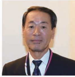
地区会員増強 (GMT)委員長