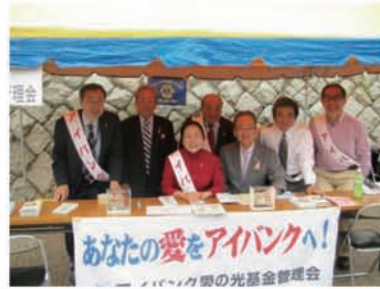
京都堀川ライオンズクラブ「第8回堀川桜まつり」にて