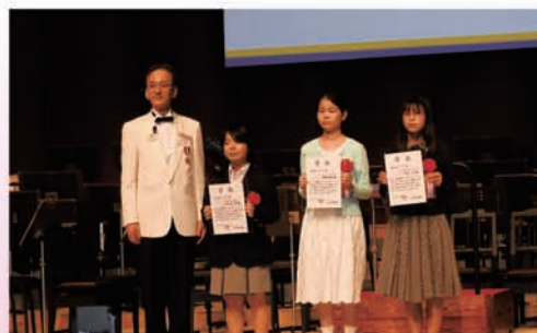
国際平和ポスターコンテスト表彰