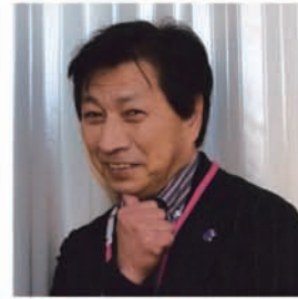
地区 YCE・ レオ委員長

2016年5月4日(水・祝)、第62回年次大会を「共生—地域と共に—」という大会テーマのもと、新装間もないロームシアター京都において、代議員総会及び式典を、第2部では京都・滋賀・奈良の小学生とご家族を招待し、京都市交響楽団、京都市少年合唱団による「音楽がつなく絆の心」コンサートを開催しました。懇親会は京都ホテルオークラで開催し、会員相互の交流と親睦を深めました。