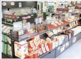
養老サービスエリア(上り線)