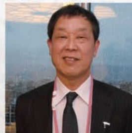
地区国際関係委員長

また、レオクラブは青少年と若年成人に、リーダーシップと奉仕活動を経験する機会を与える重要なアクティビティであり、レオクラブメンバーの増強、活動の指導に一層の努力をお願いするとともに、新クラブ結成も視野に入れた検討を改めてお願いいたします。