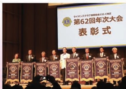
最優秀賞・優秀賞